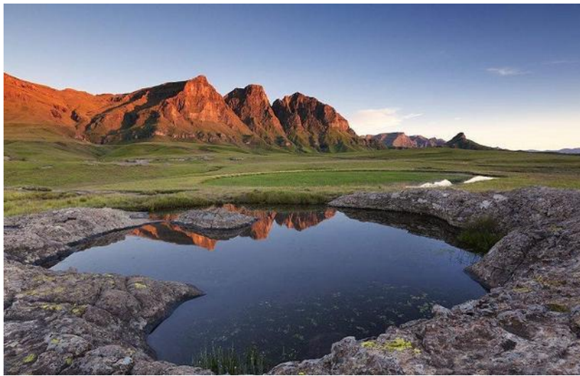
图 3 莱索托风景

【区域贸易协定】 莱索托是《洛美协定》及《科托努协定》、南部非洲发展共同体（SADC）、南部非洲关税同盟（SACU）以及兰特货币区组织成员国。莱享有美国政府提供的《非洲增长与机遇法案》（AGOA）优惠政策。莱作为 SACU 成员，参与了 SADC、东非共同体(EAC)和东南非共同市场(COMESA)贸易谈判，和其他南部非洲关税同盟成员也享有和包括阿根廷、巴西、乌拉圭以及巴拉圭四国的南方共同市场(MERCOSUR)优惠贸易协定(PTA)。2008 年，南部非洲关税同盟和包括瑞士、挪威、冰岛、列支敦士登的欧洲贸易自由联盟（EFTA）签署自由贸易协定。2009 年，莱索托同博茨瓦纳、斯威士兰、莫桑比克三国共同和欧盟签署临时经济伙伴关系协定(IEPA)。2016 年 6 月，莱索托同博茨瓦纳、莫桑比克、纳米比亚、南非和斯威士兰五国共同和欧盟签署《南部非洲发展共同体（SADC）与欧盟经济合作伙伴协议》（SADC-EU EPA）。